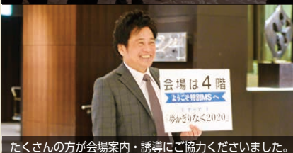
会場は4階 23:25 WMS あかさなぐ2020 たくさんの方が会場案内・誘導にご協力くださいました。