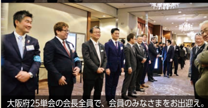
大阪府25単会の会長全員で、会員みなさまをお出迎え。