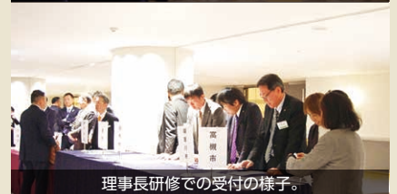
理事長研修での受付の様子。