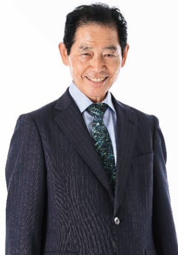
東大阪市倫理法人会 副会長