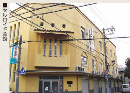
セルロイド会館 西俣 稔 (大阪案内人)