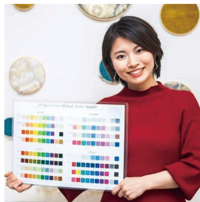
大阪みなと倫理法人会 幹事