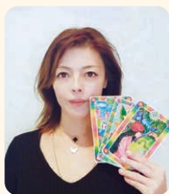
MilkyWay 齋喜 未来 会員 (道頓堀倫理法人会)