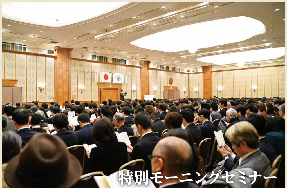
特別モーニングセミナー