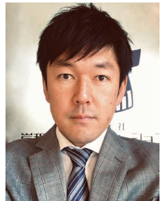
泉州倫理法人会 幹事