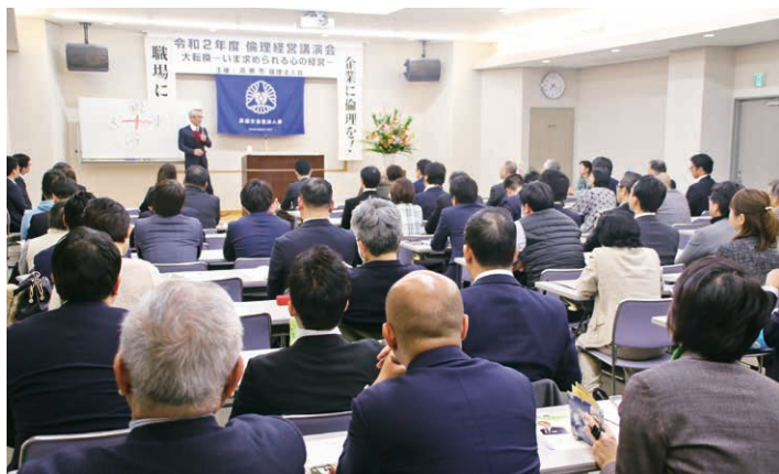
参加88名（未入会員8名）