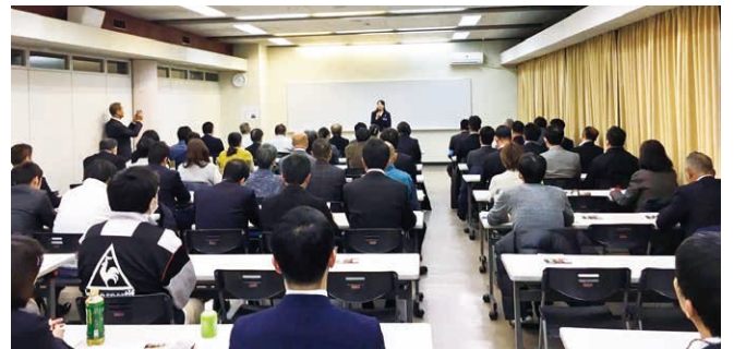
参加者70名（うち、未会員6名、朝礼委員12人）