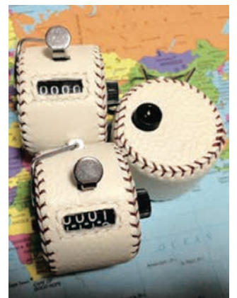
ありがとうカウンター

で百万遍プロジェクトを実践している。日本中をありがとうでいっぱいにし、世界中を笑顔でいっぱいにし、そして地球を