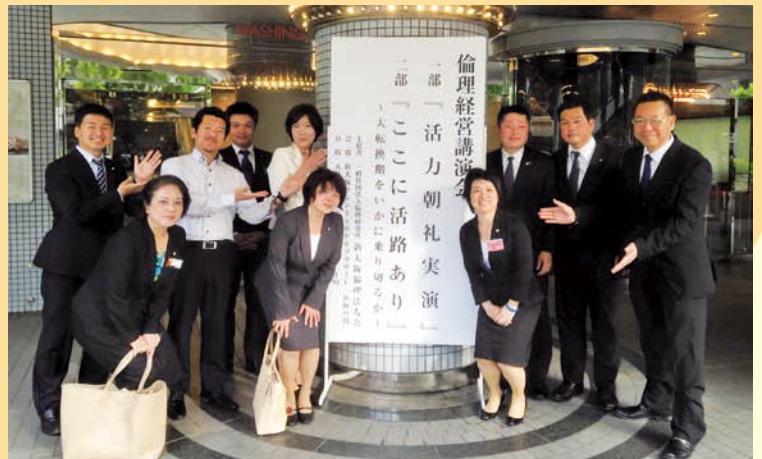
倫理経営講演会会場前