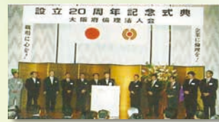
大阪府倫理法人会 20周年記念式典

〈お問い合わせ〉 大阪府倫理法人会事務局 大阪市中央区南船場2丁目4番8号 長堀プラザビル 5階 TEL 06-6125-5101