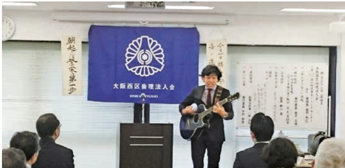
会場は笑顔であふれた