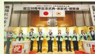
大阪府倫理法人会 30周年記念式典