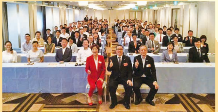
左から 4代目・5代目・3代目会長