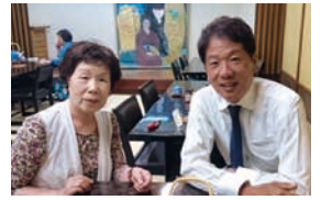
㊤母 イツヨさん、㊦本人

長男、成一は小さい頃は大人しく、手のかからない子供でした。学校の成績も良く、先生にはいつも誉められていました。しかし、少し気が優しく、泣かされて帰ってくることも多かったように思います。母親としては大人になった時の事を考えると少し心配になっていました。ところが、社会人になってからは気の弱かった性格はどこへやら…。現在は第一に親の事を思い、優しく、また毎月の仕送りもしてくれて支えてもらっています。国内・海外へと旅行に連れて行ってもらえることはとても楽しみで、いつも笑いの絶えない時間を過ごしています。倫理法人会に入会して、9月14日の息子の講話を聴いたときは、少し誇らしげに思いました。ここまで変わるものかと顔で笑って心で嬉し涙を流していました。多くの人に支えられてる姿を見て、母親としては少し安心しました。今は毎月送られてくる息子からの手紙に、ポストに行くのが楽しみな日々を過ごしています。そして、宝物が一つ増えました。