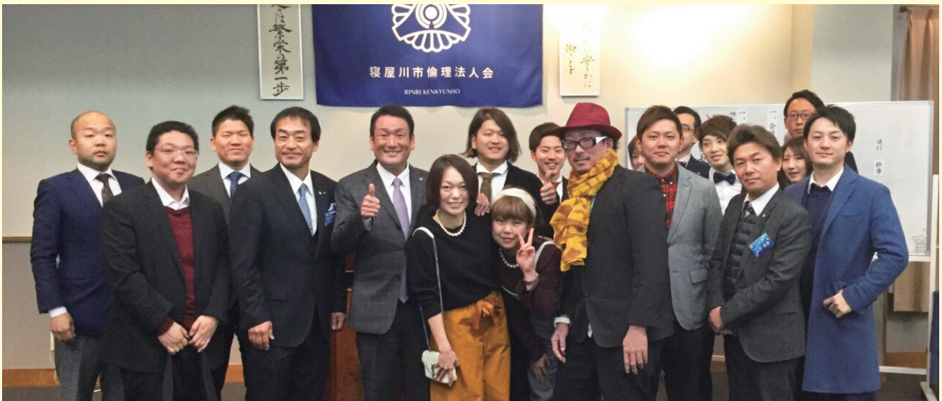
松島会長、他単会講話で全員集合