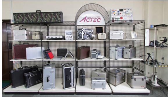
多種多様な製品が並び陳列棚。お客様の要望で1ロットからの製造販売が可能。