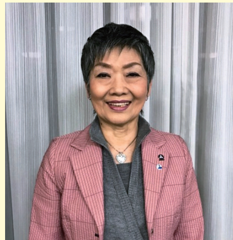
大阪北部副地区長