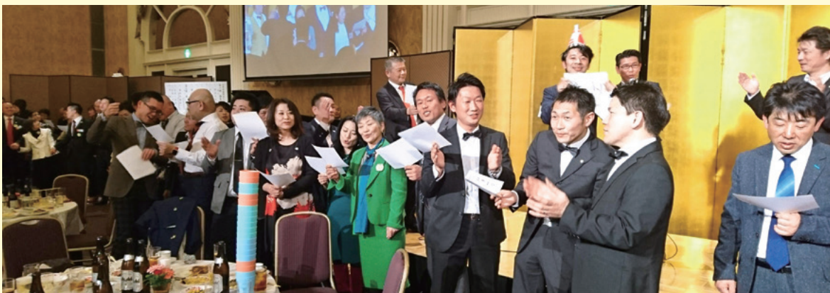
普及目標達成祝賀会式典で