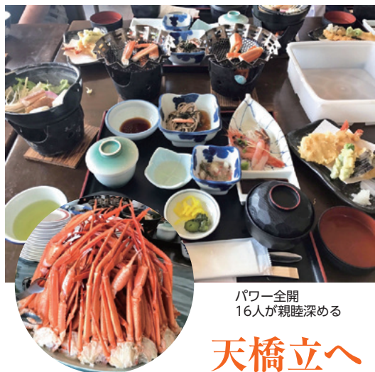
パワー全開 16人が親睦深める