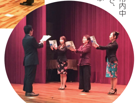
市内中地区朝礼委員さんの気合いの入った美演です

特筆すべきは、これまで『朝礼をやっている方が多かったこと』です。活力朝礼の導入が、会社を変える第一歩となることを改めて実感しました。