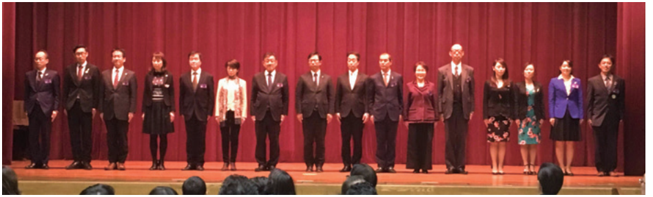
18名の朝礼委員と朝礼インストラクターが指導に集いました