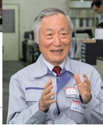
早く取材に応じていただいた芦田社長