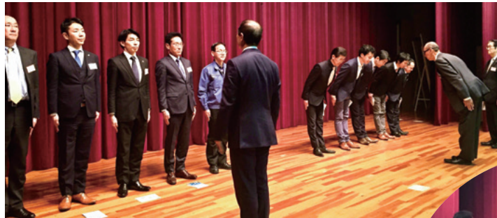
礼を揃えることに気をつけて、練習に励む参加者のみなさん

中地区朝礼委員による息のあった朝礼を手本に、参加者が各班に分かれて朝礼練習を実施しました。参加者からは「活力が出た」「声が出す大切さがわかった」「一体感が大切」「内容が充実し楽しかった」「練習してみると難しく、習慣化が大事だと思った」など、前向きな感想をたくさんいただきました。