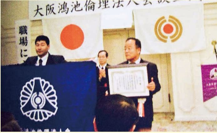
石切セイリュウでの設立式典の様子