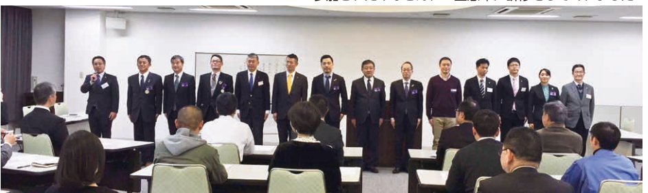
研修を行った14名の朝礼委員とインストラクターです