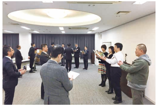
参加されたみなさん、一生懸命に研修をしてくださいました