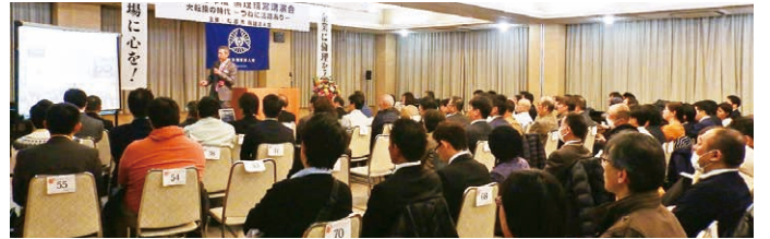
参加120名 (未入会員56名)