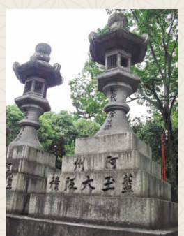
(大阪案内人・西俣稔)

前回、太鼓橋の続きです。太鼓橋は与謝野晶子も渡っていた。明治33年(1900)堺の浜寺公園での文学会で、与謝野鉄幹と出会い、晶子の一歳下の山川登美子も同席していた。翌日住吉大社を訪れ、三人で勾配のきつい太鼓橋を渡り、手を差し伸べる鉄幹に、すがりついたのは登美子で、晶子は一人で渡った。のちに結ばれた晶子と鉄幹、どんな想いであったのか。▼太鼓橋近くに小さな、井原西鶴の矢数俳諧が建つ。延宝八年(1680)、生國魂神社で4千句詠んでいた西鶴、その5倍以上、一昼夜で2万3千5百句もの俳句を詠った。貞享元年(1684)のこと。不眠不休でも一句4秒弱、驚異的な数字。余りの速さに記録者も記録できず、作品は残っていないとか。これは住吉大社は多くの参拝者で賑わい、著書売るための今でいうセールスであった。▼橋の南には御田があり、毎年6月14日に御田植神事が催されている。神職(神楽女)、らが石舞台に揃い、第一本宮で早苗と神水を頂き、武者、神職を先頭に御田に向かい、厳かに八乙女が田舞を舞う。▼大社には多くの灯籠が建ち並ぶ。江戸期には千以上もあった。明治初めの紀州街道の拡幅や、住吉公園の造営などで減ったが、それでも現在約600、高いのは約10mの灯籠もある。これは玩具や乾物商、材木商など様々な商人の信仰心と、テレビ、ラジオ、新聞など広告媒体がない時代の広告塔でもあった。