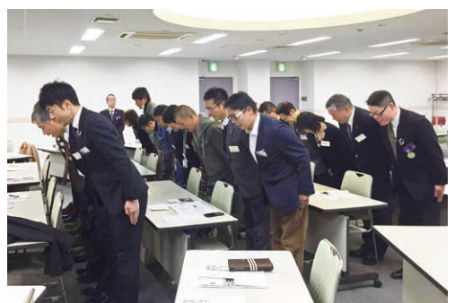
全員で礼を合わせる練習をしました