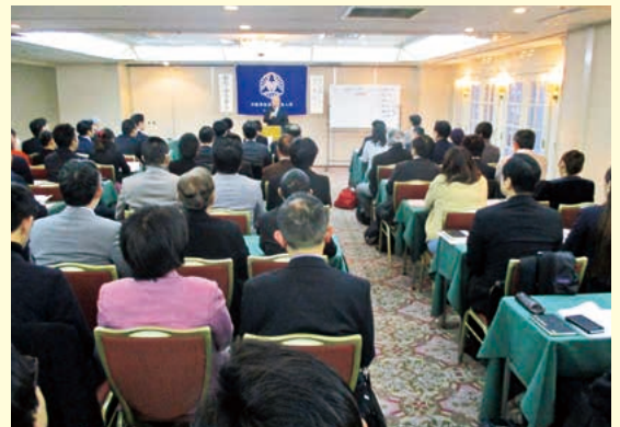
2017年12月22日のモーニングセミナー 15年ぶりに100社正単会を達成