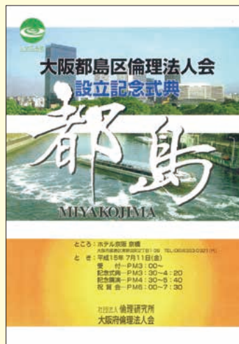
設立式典の案内状