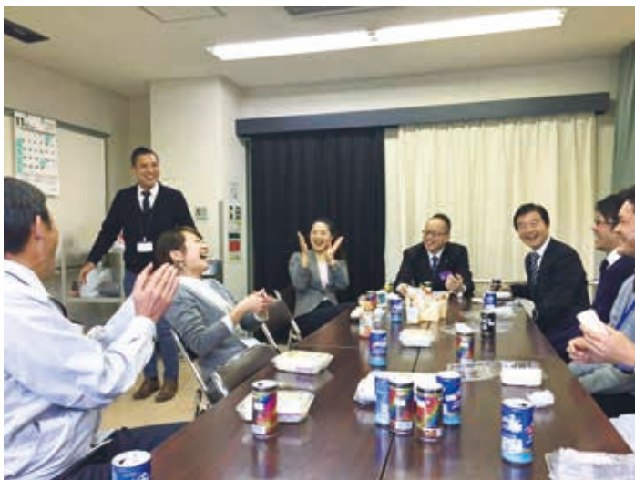
見学者との和気あいあいとした懇親会