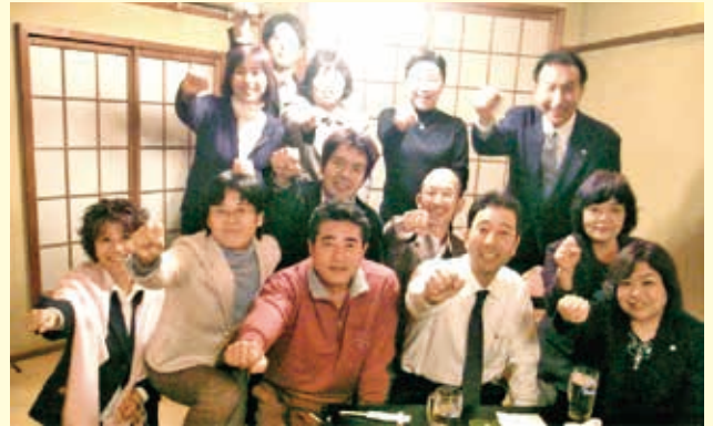
なにわニュース「やるぞ宣言」