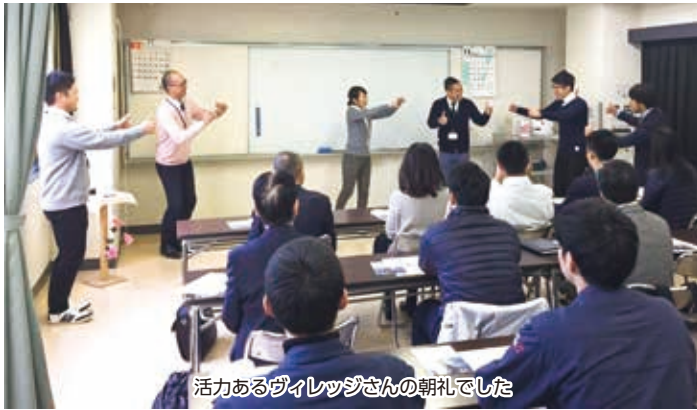
活力あるヴィレッジさんの朝礼でした