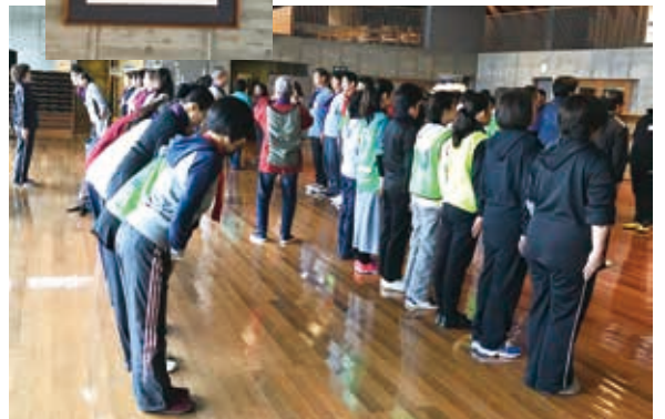
参加者全員でチーム毎での挨拶実習