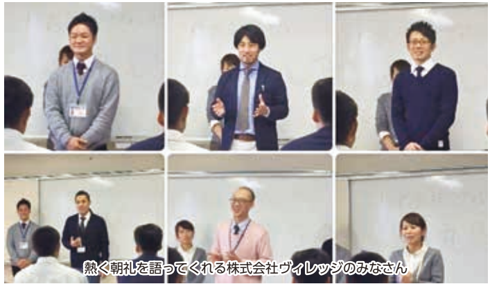
熱く朝礼を語ってくれる株式会社ヴィレッジのみなさん