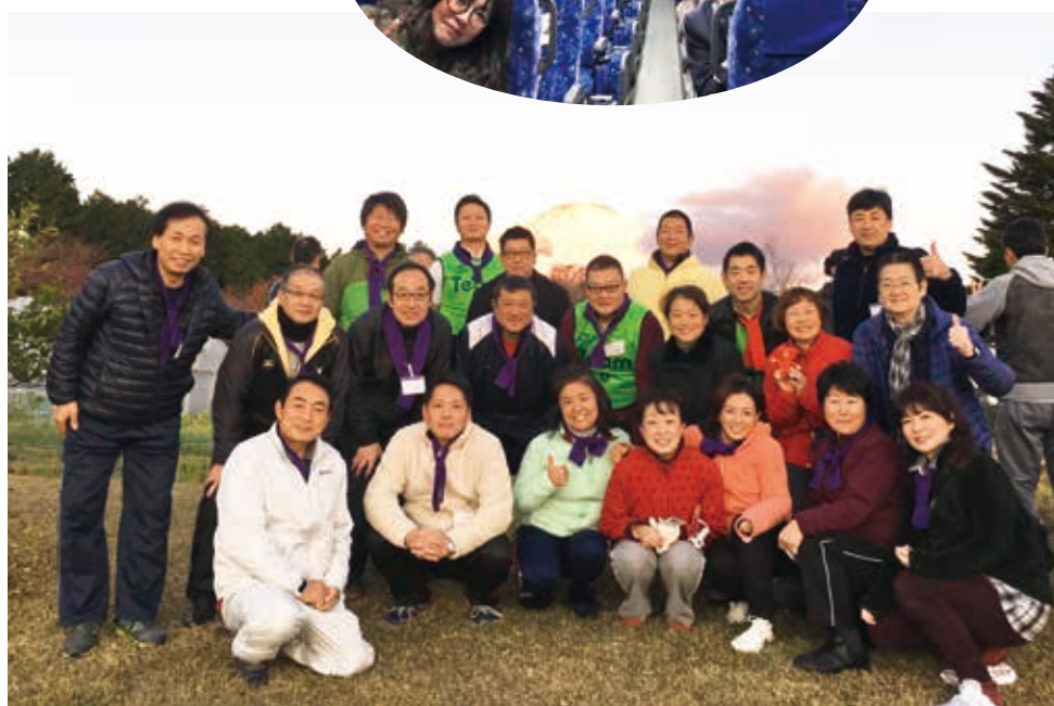
赤富士を背に参加者全員の集合写真

帰り道、両親と涙の電話をし、妻とも抱き合った。お詫びと感謝を伝え、改めて実践を誓う。また行きたいです！