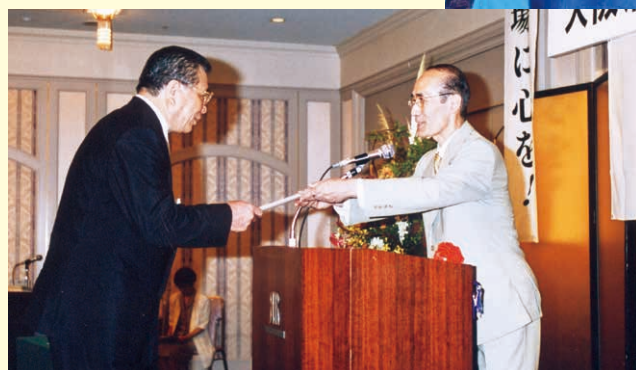
初代の村田会長と水上法人局長