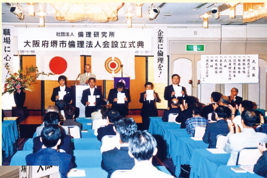
平成13年8月8日設立記念式典での辞令交付の場面