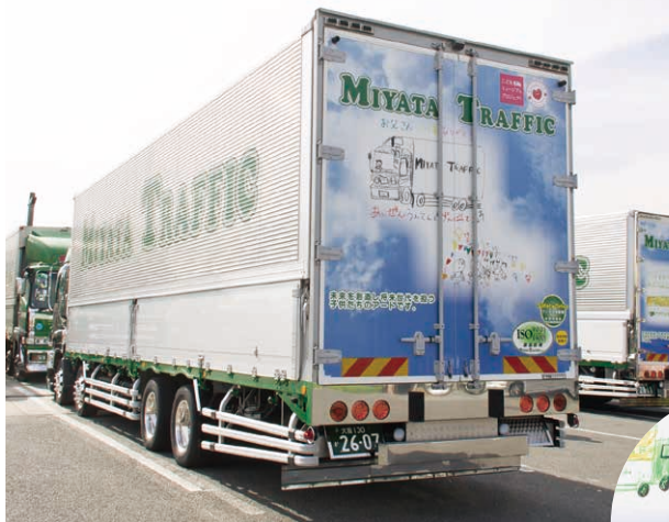
ラッピング1号トラック

5年前に社長を引継ぎ業績をあげることに意識がいったこと、その焦りと不安から4年前に死亡事故を起こしてしまったこと、その時にまわりの人の優しさや思いやりに触れ心が大切だと気づいたことなどをお話くださいました。 最低限の管理は必要だが「心で経営しよう！思いっきり理想で経営しよう！」と決められたそうです。 ある時社員さんがご自身の息子さんの描いたメッセージの入った絵をトラックに乗せていることを知り、こどもの