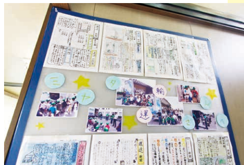
こどもたちの書いた運送新聞

メッセージは無条件に心に響く、そう感じたそうです。 そして「怖い危ない」イメージのトラックを活かす方法として、こどもの描いた絵でラッピングすることを考え形にされました。 距離を置かれる存在から写真を撮ってもらったり拝まれたり近寄りやすい存在に変わり、運転する側の心の持ち方も変わったそうです。