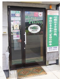
宮田運輸本社入口