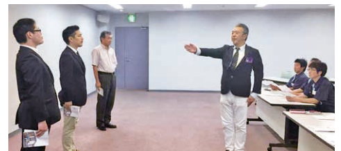
朝礼実演をする大阪東部地区の朝礼委員のみなさん

7月14日(金)東大阪市U・コミュニティホールにて、大阪東部地区の朝礼研修が行われ、25名もの方々にご参加頂きました。指導員がほぼ全員、朝礼インスタラクターという事もあり、キツリとわかり易い指導が出来たと自負しております。