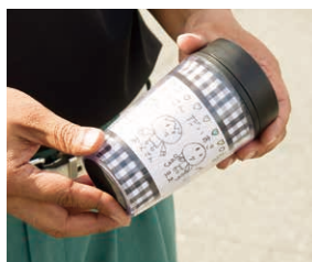
世界にひとつのタンブラー