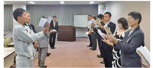
実習を行う参加者のみなさん