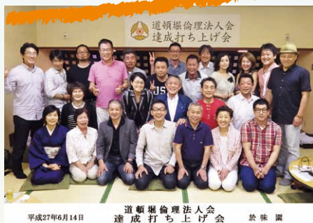
平成27年6月14日 道頓堀倫理法人会 達成打ち上げ会 於味園