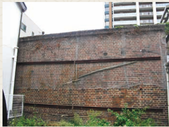
・明治末期の大火と、空襲の類焼を止めた大日本紡績工場の煉瓦塀

川跡の西、厚生年金病院北端に明治末期の紡績工場の煉瓦塀が残る。キタの大火を止めた塀で、西の玉川は類焼を免れた。一方、昭和20年の大空襲では、玉川からの焼夷弾の類焼も止めた。生死の明暗を分けた塀である。福島にも戦争や貧困、災害の痕跡が残る。「福」ある町へと、福島の地名に先人の願いが込められている。(大阪案内人・西俣稔)