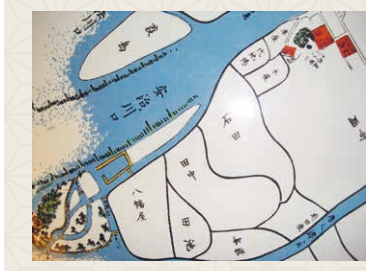
・弘化二年(1845) 大阪町 右上端の緑が「波除山」、左下が「天保山」、 新田開発者の地名が続く。