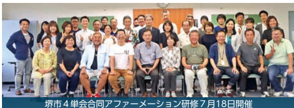
堺市4単会合同アフターメーション研修7月18日開催