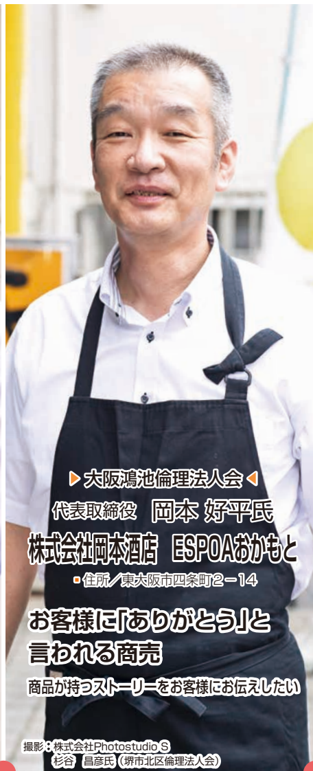
▶ 大阪鴻池倫理法人会 ◀