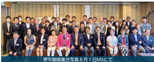
堺市御陵集合写真 8月1日MSにて