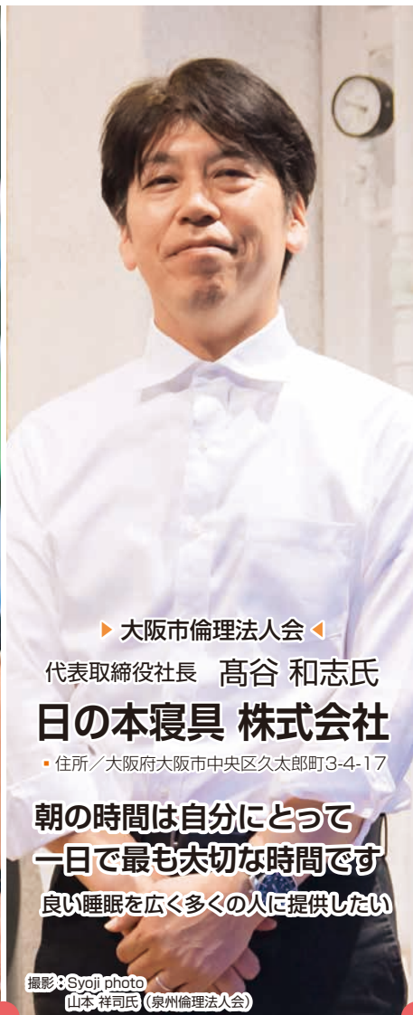
▶ 大阪市倫理法人会 ◀