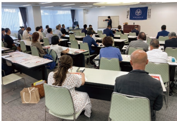
東大阪市倫理法人会・MSの様子

【朝食会】MS終了後は自由参加で朝食会を開催。異業種交流と情報交換の場として積極的に活用されています。