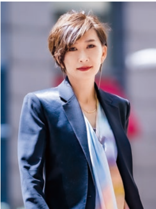
千里中央倫理法人会 会員

会社のことや家庭のことなど、どんなことでも相談でき、何度でも 無料 で的確な指導を受けることができる制度です。詳しくは所属単会の会長にお尋ねください。