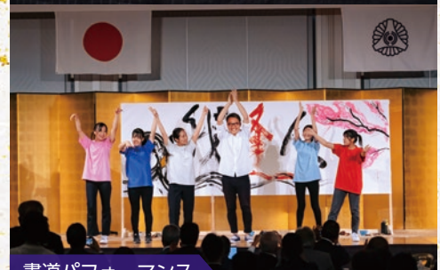
書道パフォーマンス