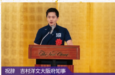
祝辞 吉村洋文大阪府知事