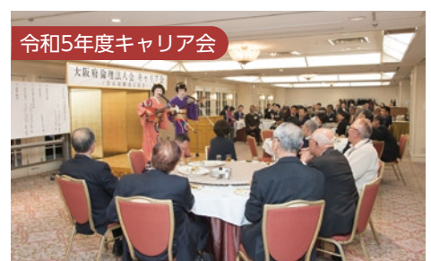
令和5年度キャリア会