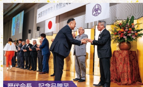
歴代会長 記念品贈呈