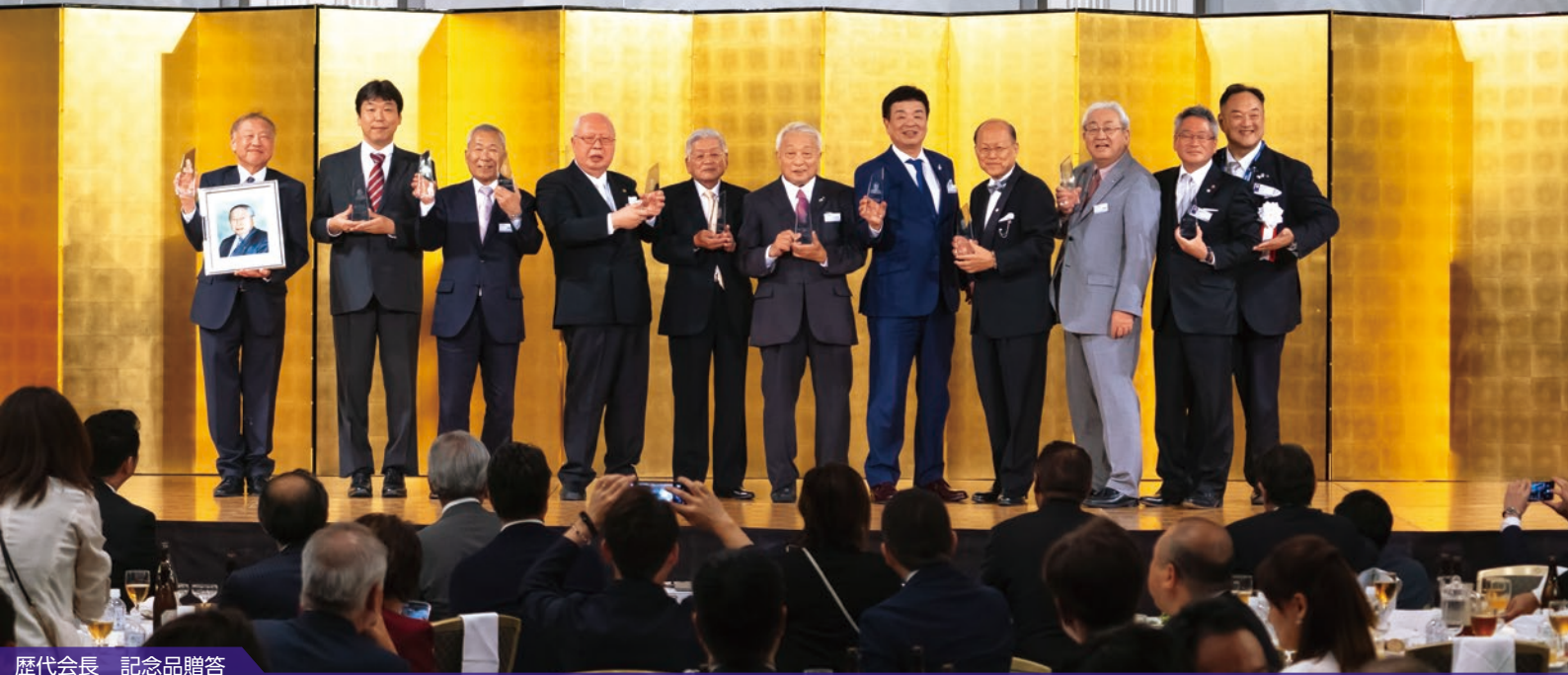
歴代会長 記念品贈答