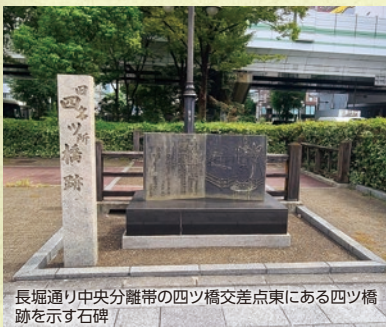
長堀通り中央分離帯の四ツ橋交差点東にある四ツ橋跡を示す石碑

舟運を盛んにするため、総てが太鼓橋に改修された。戦後、自動車の交通量が増加して、昭和39年(1964年)には西横堀が埋め立てられ、昭和45年(1970年)