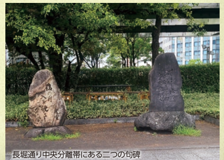
長堀通り中央分離帯にある二つの句碑

「後の月 入て貌よし 星の空」上島鬼貫。後の月とは、8月(陽暦9月)の15夜に次いで愛でる9月(陽暦10月)の十三夜のことである。つまり、前月の十五夜の月の豊かな顔の残像と、今宵の十三夜の月の良い顔が重なって、ふと月の周囲の夜空に目を向ければ満天の星が煌めいている、というような意味か。江戸時代には四ツ橋から夜空を仰げば、満天の星が見えたのだ。近世大坂町民の天体への興味が垣間見えるのではないか。