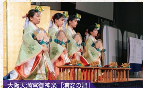
大阪天満宮御神楽「浦安の舞」