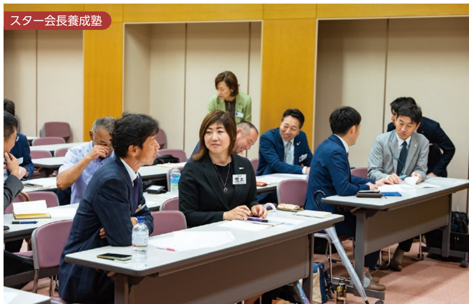
スター会長養成塾

■年に一度の歴代会長会は、感謝の会です。これまでの縦の繋がりをじっくりと感じ、ノウハウを受け継ぎ、大阪府のパワーを実感します。