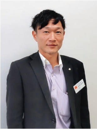
東大阪市倫理法人会 副専任幹事