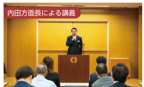
内田方面長による講義