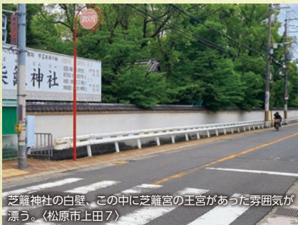
芝籬神社の白壁、この中に芝籬宮の王宮があった雰囲気がかかっている。(松原市上田7)

翌日、三男の皇子(次の反正天皇)が丹比から軍勢を率いてやってきても、天皇は疑って会わない。丹比の皇子は兄の住吉中皇子を倒すしかなかった。中皇子の家来の曾婆訶理に、反逆者を倒すなら、お前をその功で大臣(総理大臣)にしようと言われて主人を暗殺させた。曾婆訶理は揚々と主の首を持って大和との国境にいた皇子の陣にやって来る。その場で曾婆訶理を大臣にする宴が始まった。彼は有頂天になり、酒を勧められるだけ飲んだ。主を裏切る者に民の統治者が勤まるかと、有無を言わず首を刎ねられてしまった。