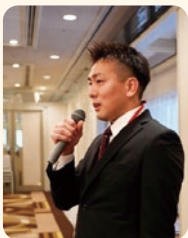
蓮々ART たるみ れんや 樽見 蓮耶 実行委員 (新大阪倫理法人会)