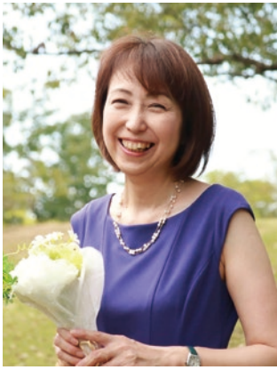
高槻市倫理法人会 副会長