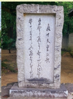
履中天皇が埴生野で野営した時に詠んだ歌の石碑。丹比野に寝むと知りせば立薦(たつこも) 風雨を防ぐ幕(かさ)を持ちて来(こ)ましもの 寝むと知りせば(堺市美原区 丹比(たんび)神社)