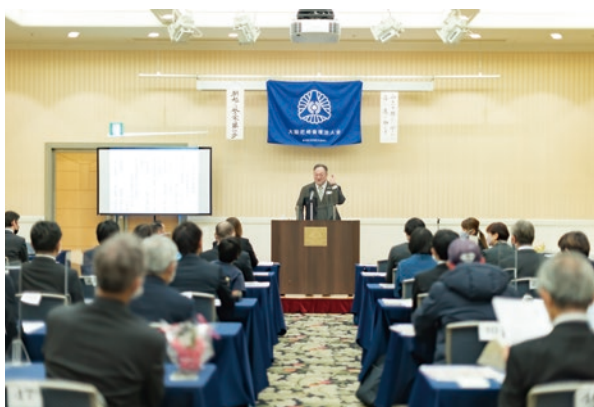
大阪尼崎倫理法人会・MSの様子

【朝食会】MS終了後は自由参加で朝食会を開催。異業種交流と情報交換の場として積極的に活用されています。