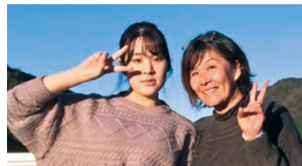
(下の写真) ◎芳佳さん、◎本人