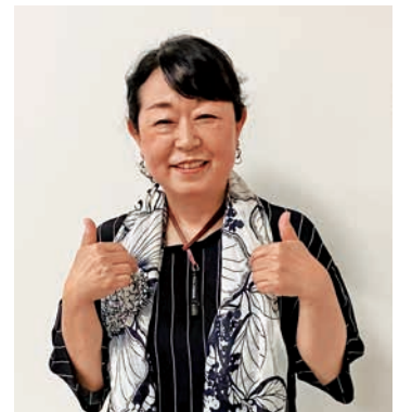
枚方・交野倫理法人会 副専任幹事

会社のこと、3月に泉方面長の倫理指導を受けました。泉方面長からは、すぐに「夫に相談しなさい。」とご指導を頂きました。最初は「えっ？」と思いましたが、会社は私一人で起業して、夫は業務にも一切関わっていませんでした。夫は福島県に単身赴任していますが、コロナも収まり、帰省するタイミングでしたので、すぐに相談しました。すると、私が悩んでいた大半がスッと解決していきました。また神棚を作り、毎日先祖に手を合わせることもご指導頂きました。神棚もすぐに作り、毎朝起きると神棚に手を合わせています。