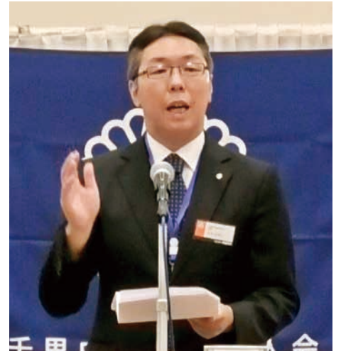
千里中央倫理法人会 幹事