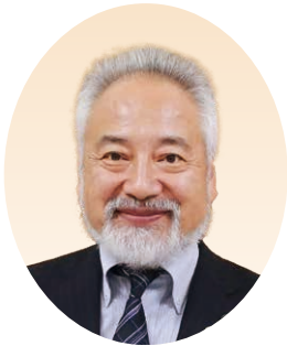
市内西地区 地区長