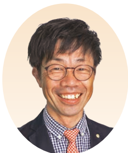
大阪西部地区 地区長