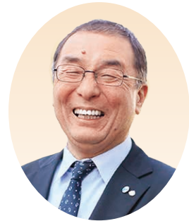
市内中地区 地区長