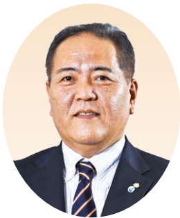
大阪北部地区 地区長