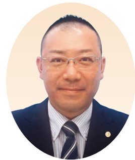
大阪東部地区 地区長

持たせてくれるいつでもどこでもの枚方交野は、役員の方々の連携が深まっております。今期新会長となりました茨木市は早々に目標達成をされ会員の居場所作りを掲げスタートいたしました。 今期は昨年度以上に、副地区長と共に各単会の側面支援、後方支援に努めてまいります。 現会員の皆様、今年度新たに会員になられる方々と倫理関係を深め喜びを共にできる地区を目指しましょう。