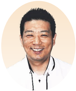
南大阪東部地区 地区長