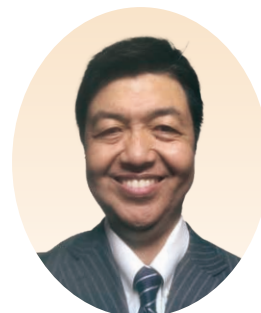
市内北地区 副地区長

に協力しID普及を実践します。 ③委員会というツールを十分に活用して単会活性につながるよう支え続けます。 私にはピンチという概念がありません。ただただ未来を生み出すことのみです。倫理法人会はしっかりそれらをサポートしてくれる。一本の筋を作ってくれます。この地区長のお役を通して、役を知り・役に徹し・役を超えない、美しい組織づくりを実践して今期末には全単会の達成に涙を流します。